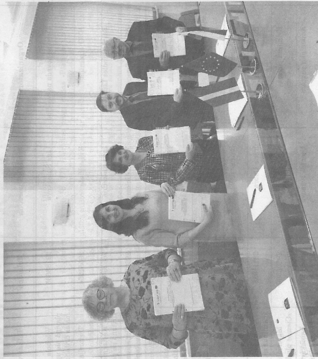
Projekta partneri pēc līguma parakstīšanas Dobeles novada domē.