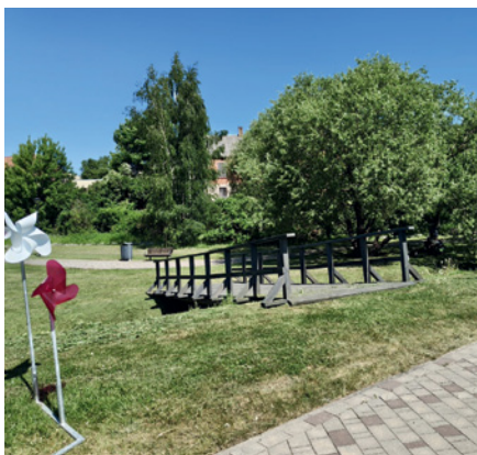
Izveidotā koka konstrukcija Pļavas ielas terasē.

Paralēli minētajiem avārijas seku likvidēšanas darbiem aktīva darbība norisinājās arī pilsētas rekreācijas zonu labiekārtošanā. Pļavas ielas terasē ar Dobeles pilsētas pārvaldes spēkiem un resursiem tika izbūvēts jauns infrastruktūras objekts – koka konstrukcijas tilts-pāreja. Šis objekts sākotnēji ir projektēts kā funkcionāls papildelements Dobeles pilsētas svētku kultūras programmas un priekšnesumu nodrošināšanai, tomēr izbūvētā konstrukcija ir ilgtspējīgs risinājums, kas nākotnē kalpos kā universāla platforma un tehniskais atbalsts arī citu publisko un kultūras pasākumu organizēšanai pilsētā.