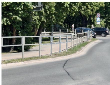
Atjaunotās barjeras pēc ceļu satiksmes negadījuma.

Šo darbu operatīvu izpildi nodrošināja pašvaldības kapitālsabiedrība SIA “Dobeles komunālie pakalpojumi”, apliecinot gatavību efektīvi novērst avārijas sekas pilsētas publiskajā telpā.