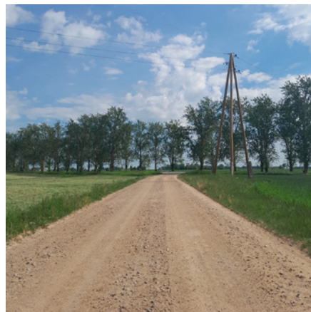
Autoceļš Nr. AU4623 Zemgalieši–Tilaiši–Siļķes pēc uzturēšanas darbu veikšanas.

Maijā novada teritorijā veikti grants seguma autoceļu un ielu planēšanas un greiderēšanas darbi 321,649 km kopgarumā: