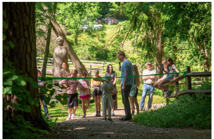
Sprīdīšu parka atjaunoto taciņu atklāšanas pasākums 2026. gada 7. jūnijā.