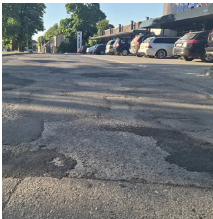
Asfaltbedrīšu remonts Baznīcas ielā, Dobeļē.

Paralēli lauku ceļu sakārtošanai pilsētas teritorijā aktīvi strādāja pašvaldības kapitālsabiedrība SIA "Dobeles komunālie pakalpojumi". Uzņēmums likvidēja ziemā un pavasarī sezonā radušos seguma defektus Dobeles pilsētas ielās.