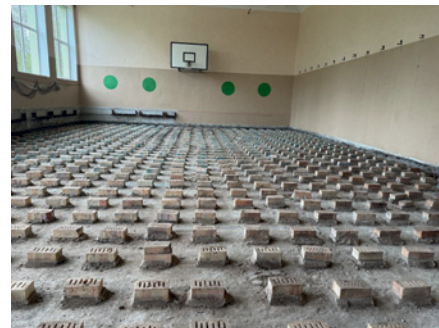
Naudītes sporta zāles grīda pirms tālākajiem atjaunošanas darbiem.

Lai sekmīgi pabeigtu sporta zāles grīdas atjaunošanu, nākamajā posmā vēl ir paredzēta grīdas slīpēšana, līniju marķēšana un lakošana.