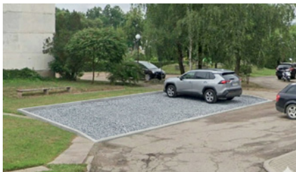
Vizualizācija labiekārtotai teritorijai Vītiņu ielā 19A/3, Aucē – automašīnu stāvlaukuma ierīkošana

divu dažādu objektu tehnisko sakārtošanu un vizuālo uzlabošanu, apvienojot brīvdales kultūras infrastruktūras atjaunošanu ar administratīvo telpu iekšdarbiem.