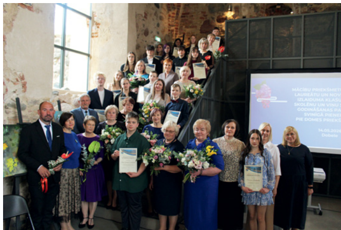
Dobeles pilī godinātie skolēni, pedagogi un skolu direktori.