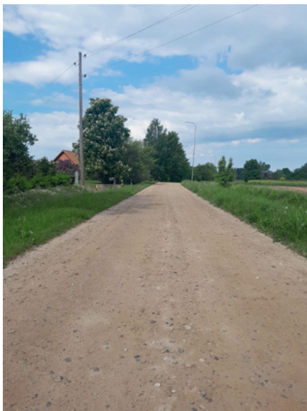
Parka iela Auru pagastā pēc preptutekļu absorbenta iestrādes.

Atputekļošana samazina putēšanu sausos laikapstākļos, uzlabo satiksmes drošību un dzīves kvalitāti piegulošajās teritorijās, kā arī mazina ceļa seguma nodilumu un uzturēšanas izmaksas ilgtermiņā.