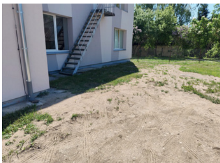
Lietus kanalizācijas izbūve ēkai E. Francmaņa ielā 5, Dobeļē.

Īstenotie infrastruktūras uzlabojumi sniedz vairākus būtiskus un ilgtermiņa ieguvumus gan apkārtnes iedzīvotājiem, gan pilsetvidei kopumā: