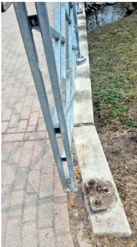
Konstatētie gājēju tiltiņa defekti.

Vairākās pilsētas vietās atjaunoti un nokrāsoti soliņi, uzlabojot to tehnisko stāvokli un izskatu. Nomainītas bojātās detaļas, veikta virsmu attīrīšana un apstrāde ar pārklājumiem, kas noturīgi pret laikapstākļu iedarbību, tādējādi pagarinot soliņu kalpošanas laiku un nodrošinot iedzīvotājiem ērtu un drošu atpūtas iespēju. Darbus veica Dobeles pilsētas pārvaldības nodaļas remontstrādnieki.