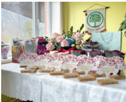
"Zelta ābeles" jubilejas pasākumā.

Tā sanācis, ka ar tiem ansambļiem esmu pinusies visu savu mūžu. Esmu vadījusi gan sievietes ansambļus, gan jauktos, gan vīru