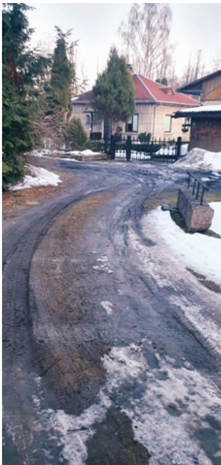
Arāju iela Dobeļē pirms seguma atjaunošanas.

• Dobeles pilsētā ar drupinātu granti atjaunots Arāju ielas segums, darbu izmaksas 1800 eiro (bez PVN).