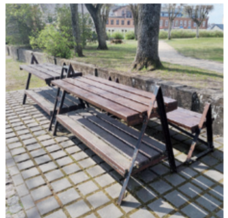
Atjaunotie soliņi Dobelē.

Dobeles pilsētas teritorijā regulāri tiek veikti dažādi saimnieciskie darbi, lai uzturētu un uzlabotu publiskās ārtelpas kvalitāti, drošību un vizuālo pievilcību. Pārskata periodā īpaša uzmanība tika pie-