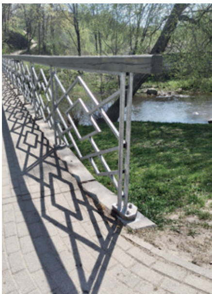
Tiltiņš atjaunots – defekti novērsti.

Gājēju tiltiņam atjaunotas margas un novērsti konstatētie defekti, nostiprinātas konstrukcijas, atjaunots aizsargpārklājums un uzlabota tiltiņa kopējā drošība, gādājot par drošu pārvietošanos visiem tā lietotājiem. Darbus izpildīja SIA "Arelu", izmaksas – 400 eiro.