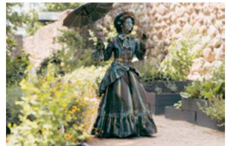
Dārzā varēs satikt arī pašu Elizabeti Magdalēnu Ketleri.

Abu partneru speciālisti ir uzsākuši darbu pie kopīga tūrisma maršruta “Dobele–Akmene” izstādes, kas tiks publicēts nacionālajos tūrisma portālos latvia.travel un lithuania.travel .