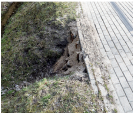
Ietve Dobeļē – izskalojuma sekas.