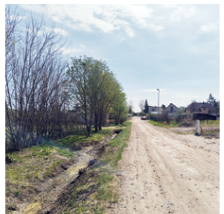
Grāvja tīrīšana posmā no Kalna ielas 14 līdz Kooperācijas ielas grāvī.