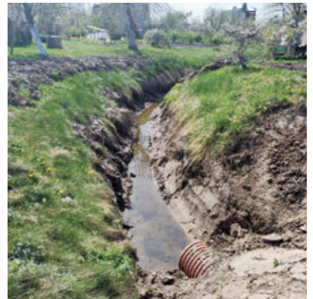
Grāvja tīrīšana un caurtekas izbūve posmā no Kooperācijas ielas 4B līdz Brīvības ielai 31A.

Kopējās darbu izmaksas ir 10 389,76 eiro bez PVN. Darbi veikti atbilstoši noslēgtā līguma nosacījumiem, nodrošinot kvalitāti un ilgtspējīgu lietus ūdens novadīšanas infrastruktūru.