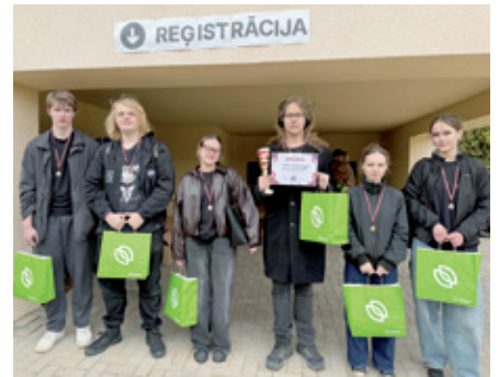
Dobeles Valsts ģimnāzijas komanda “Medikopteri”.

Uzvarētāji – Dobeles Valsts ģimnāzijas komanda “Medikopteri”.