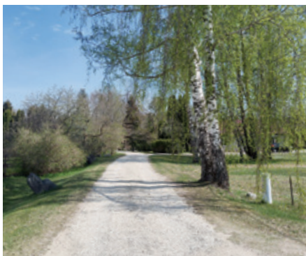
Arāju iela Dobeļē pēc seguma atjaunošanas.