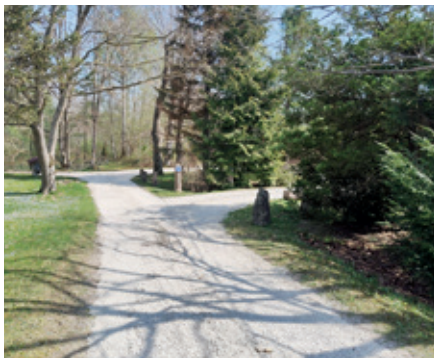
Arāju iela Dobeļē pēc seguma atjaunošanas.