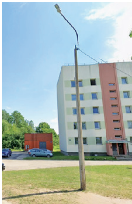
Atjaunojamā ielu apgaismojuma tīkla posms Krišjāņa Barona ielā, Dobelē.

līgums ar SIA "Dobeles būvnieks" par līgumcenu 25054,07 eiro (bez PVN). Darbu izpilde plānota atbilstoši noteiktajam grafikam, ievērojot spēkā esošās būvnormatīvu un kvalitātes prasības.