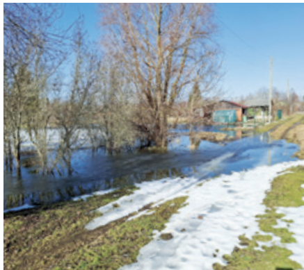
Meliorācijas sistēmas defekts Auru pagastā.

Veiktās cenu aptaujas rezultātā uzņēmējs SIA "Avotiņi" veica darbus, un augstāk uzskaitītie defekti nu ir veiksmīgi novērsti. Līguma summa – 9260 eiro (bez