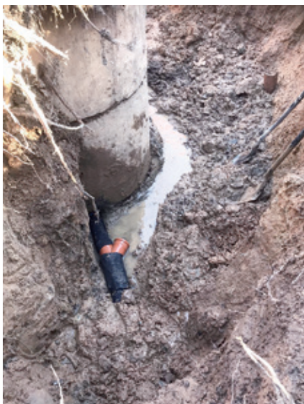
Meliorācijas sistēmas defektu novēršana Auru pagastā.

Veiktās cenu aptaujas rezultātā uzņēmējs SIA "Avotiņi" veica darbus, un augstāk uzskaitītie defekti nu ir veiksmīgi novērsti. Līguma summa – 9260 eiro (bez