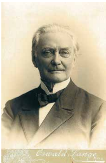
Pirms 140 gadiem Augusts Bilenšteins organizēja pirmos Dobeles pils mūru konservācijas darbus. Lielā mērā pateicoties tieši viņa centieniem, Dobeles pils ir saglabājusies esošajā apjomā.

novada muzejs, Dobeles Pieaugušo izglītības un uzņēmējdarbības attīstības centrs, bet ēkas trešajā stāvā joprojām darbojas zobārstniecības kabinets.