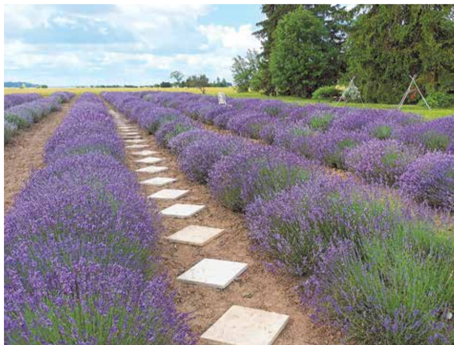
"RoLavandas" brīnišķīgais lavandu lauks.