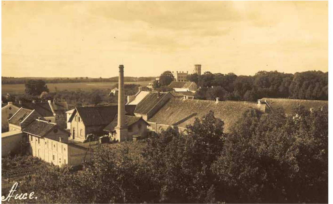
Auce 20. gs. 20. gadi.

Šogad aprit 50 gadu, kopš 1974. gada 29. novembrī tika atklāta Dobeles jaunā poliklīnikas ēka. Mūsdienās ēkā izvietots Dobeles