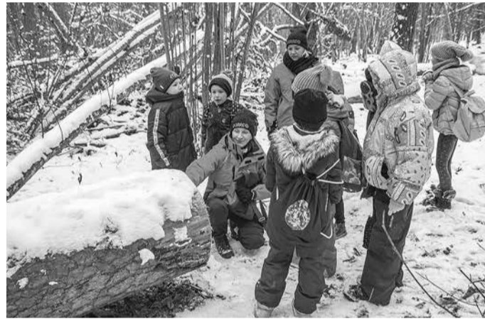
Vides izglītība pieejama visu gadu kopā ar parka vides izglītības speciālistēm.

Dabas parks Tērvetē piedāvā ne tikai atpūtas un izklaides iespējas, bet arī iespēju apgūt dažādas meža gudrības visa gada garumā. Jau vairāk nekā 10 gadus parks aug un veidojas par skolēnu vides izglītības centru, piedāvājot daudzveidīgas izziņas ekskursijas un nodarības, radošas darbnīcas LVM vides izglītības programmā “Izzini mežu”. Tā