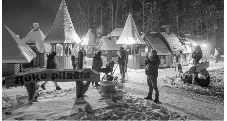
Rūķu pilsēta Čiekure – apmeklētākais parka objekts visos gadalaikos.

Šogad parka apmeklētājus gaida vairāki jaunumi – pēc vētras citā veido-