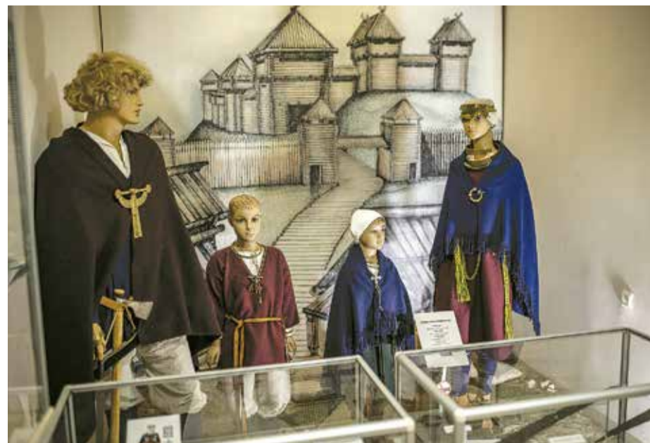
Dobeles novada muzejā arvien skatāmas interesantas ekspozīcijas.

Dobeles novada pašvaldības Sabiedrisko attiecību nodaļa sadarbībā ar Dobeles novada Tūrisma informācijas centru