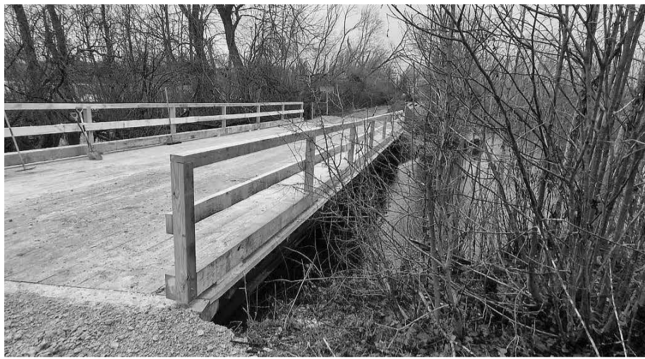
Atjaunotais Svētes tilts prasa ievērot stingrus transporta masas ierobežojumus.

VSIA "Latvijas Valsts ceļi" Komunikācijas daļa