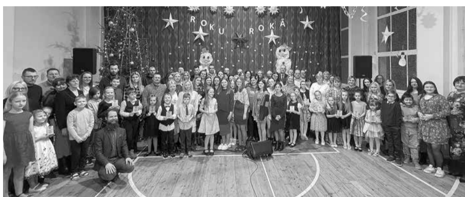
"Roku rokā" kopbilde.