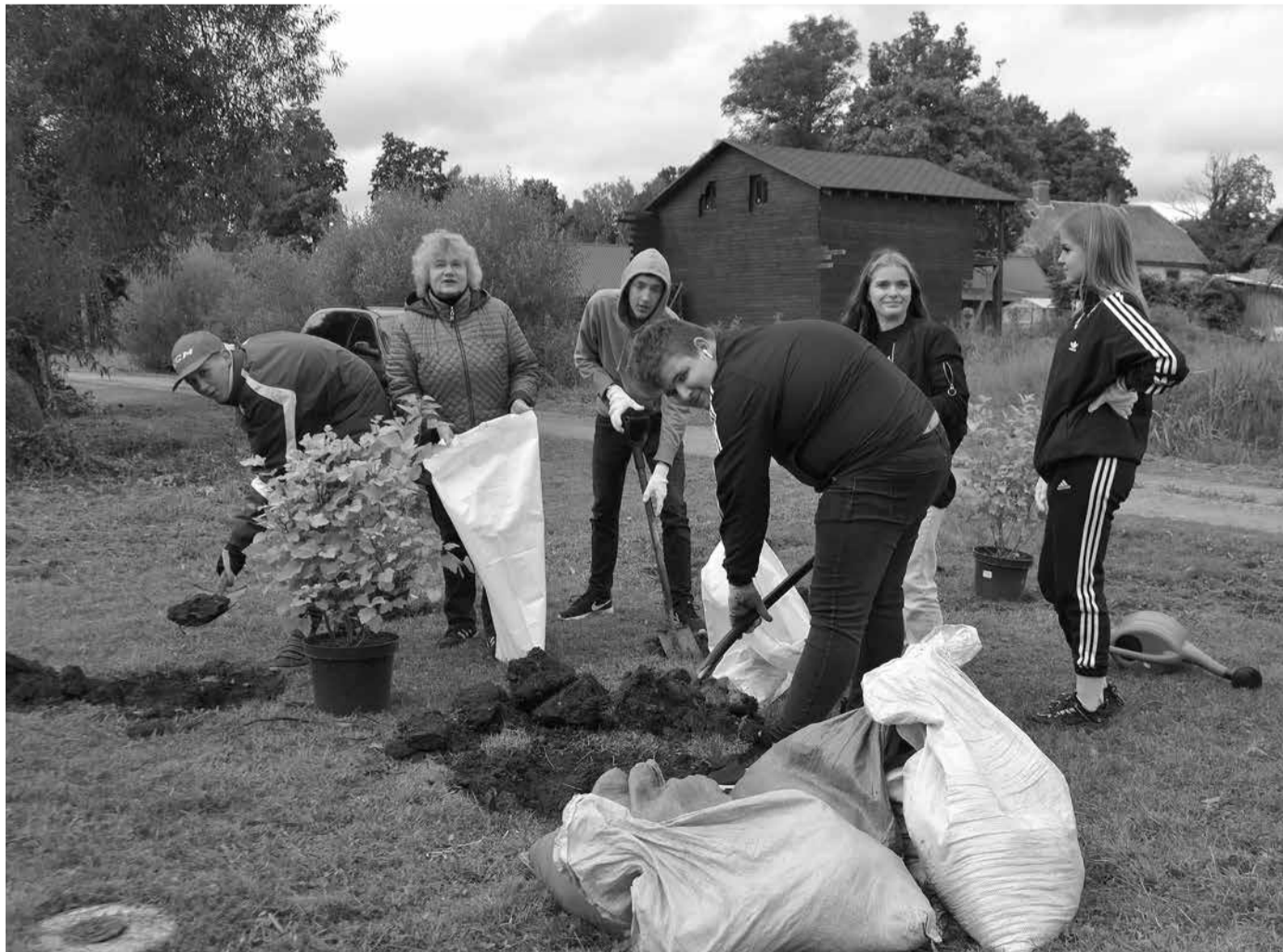
Meža dienās kopā ar skolēniem parkā pie mūzikas skolas.

Dobeles novada pašvaldības Sabiedrisko attiecību nodaļa