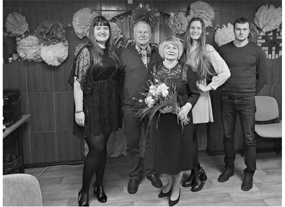
Vija kopā ar Infrastruktūras nodaļas kolēģiem.

Jā, nāca klāt darbs ar zaļumsaimniecību, kapu un sētnieku nozari. Dažādi saimnie-