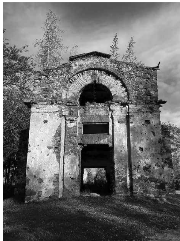
Sņķeres torņa ieeja.

BaznĪca bijusi viens no pagasta dzĪves centriem. Ieskatoties 20. gs. 30. gadu presĒ, redzams, ka katrs lielĀks pasĀkums atzĪ-