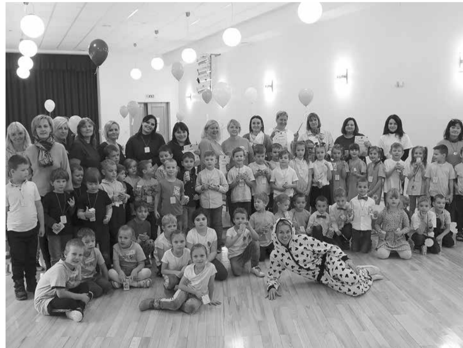
Veiksmīgākie pirmsskolas konstruētāji.