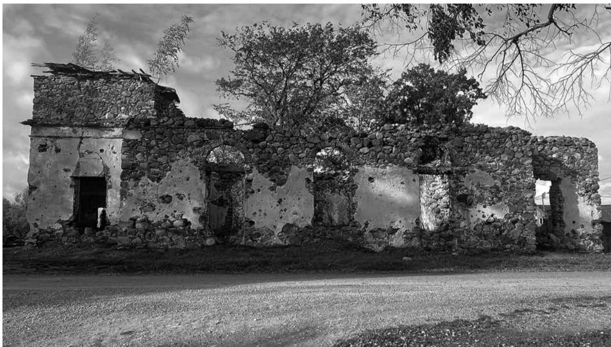
Sņķeres baznĪcas sĀnskats.

Izbraucot cauri Ukru pagasta Sņķeres ciemam, pĀrsvarĀ redzamas padomju gados celtas bŪves. Starp tĀm izceļas baznĪcas drupas, kas liecina – Őai vietai ir senĀka vĒsture. Sņķeres teritorijĀ 17. gadsimtĀ atradusies Kukuru muiža, tĀdĒļ Őeit uzceltĀ baznĪca saukta arī par Kukuru baznĪcu.