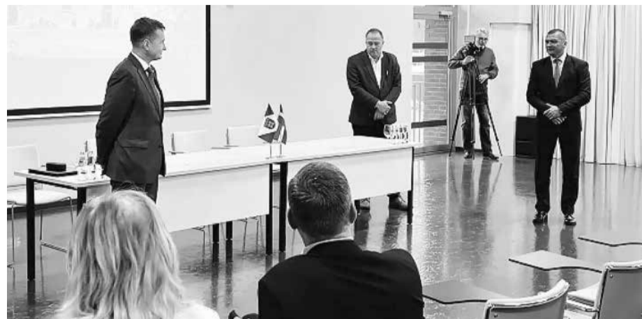
Zemkopības ministrs Armands Krauze Dobelē.