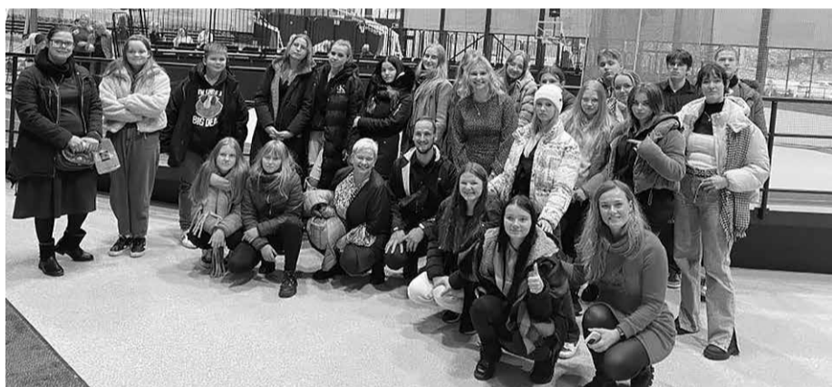
Skolēnu pašpārvalžu jaunieši pieredzes apmaiņas seminārā.