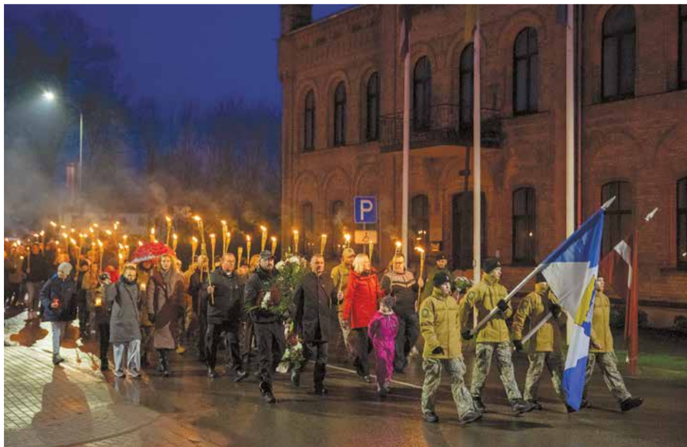
Lāčplēša dienas lāpu gājiens Aucē.