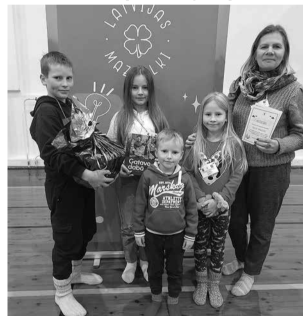
Penkules pamatskolas Mazpulka komandas uzvaras prieks.

Saņemot tik daudz prieka un pārsteigumu, Penkules pamatskolas skolēni vēlējas prieku sagādāt arī saviem vecākiem. Skola rudens brīvlaikā tradicionāli organizē tikšanos ar skolēnu vecākiem, šajā mācību gadā tās bija individuālas