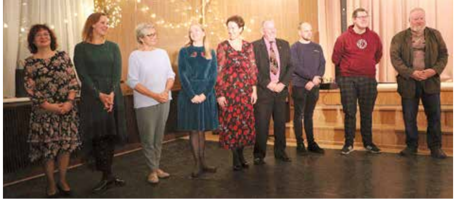
Īles Kultūras skolas klases audzinātāji (pašdarbības kolektīvu vadītāji).

"Pasākuma laikā tika dibināta Īles Kultūras skola, un tās direktore lika pie darba kolektīvu vadītājus kā topošās skolas klašu audzinātājus. Pasākumā beigās savu ziņojumu sniedza arī Dobeles novada pašvaldības Kultūras