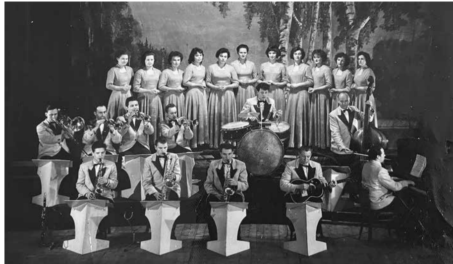
Auces pilsētas kultūras nams 1961. gadā.