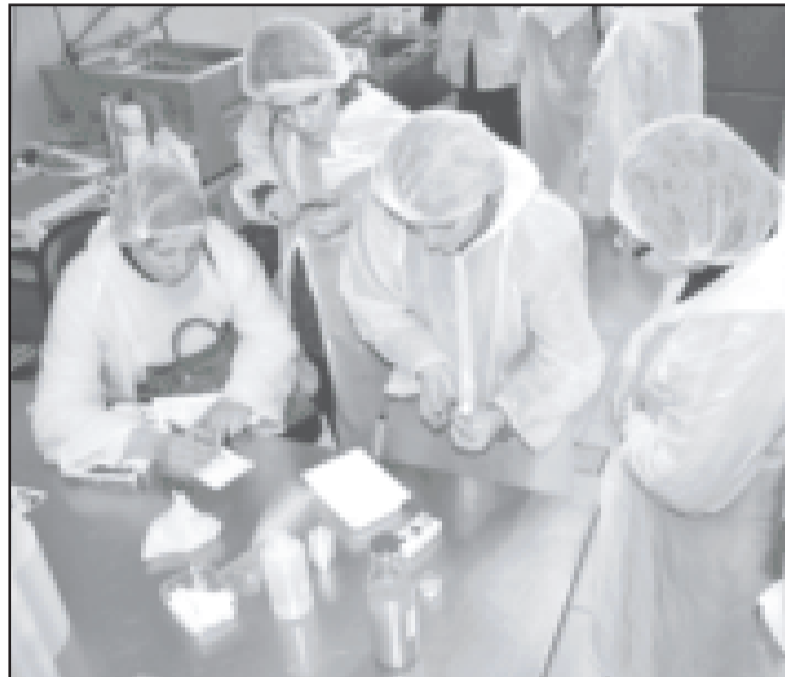
Vietējie mājražotāji Latvijas Valsts augļkopības institūta laboratorijā.

31. janvārī Dobeles novada uzņēmēji tika aicināti uz pirmo šī gada tikšanos, lai kopīgi izvērtētu Dobeles PIUAC paveikto 2012. gadā, ieceres un plānots pasākumus uzņēmējiem 2013. gadā. Uz aicinājumu tikties atsauces 31 uzņēmējs.